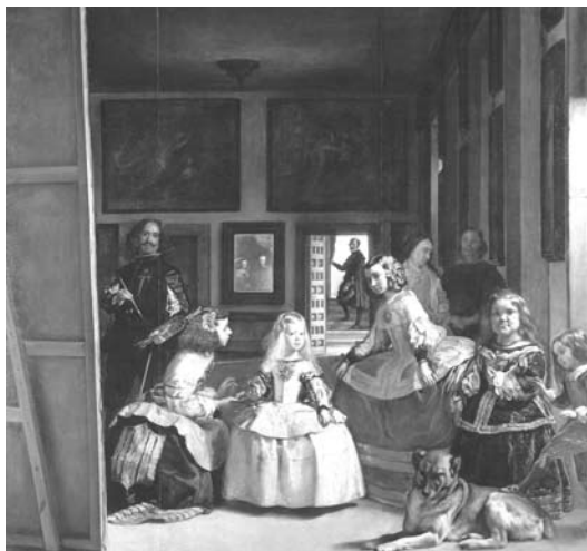
Las meninas , de Diego Velázquez, Museu do Prado, Madri.

triz con sus damas y una enana , em 1666, e La familia del señor rey Phelipe Quarto , em 1734. Virou definitivamente Las meninas no catálogo escrito por Pedro de Madrazo em 1834. Ele usou o vocábulo português (meninas) que designava as acompanhantes das crianças reais no séc. XVII (Marini, 1998:122). 4